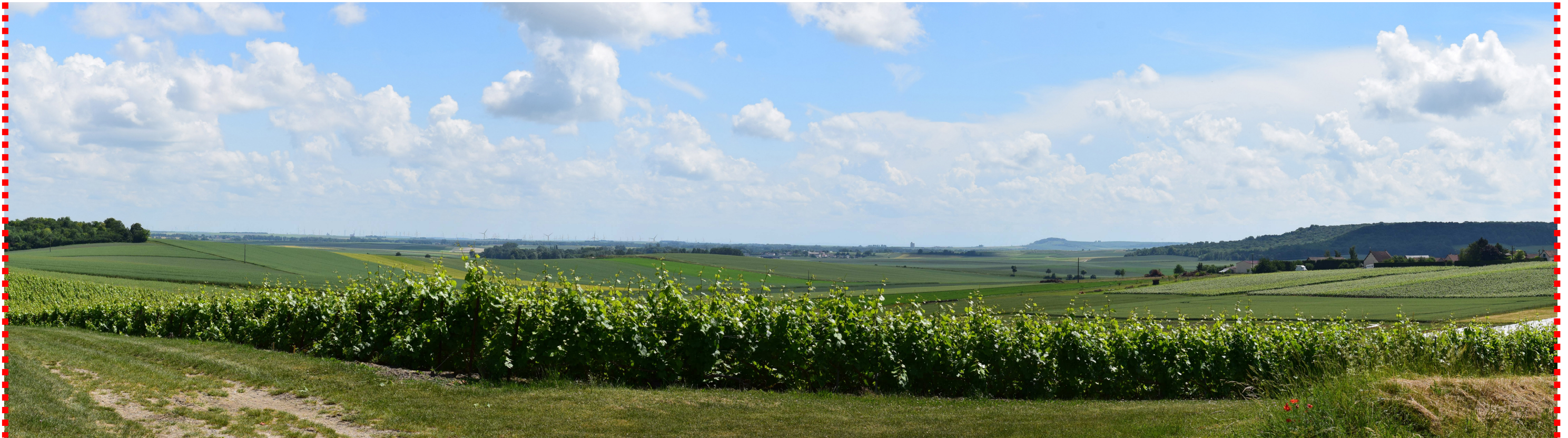
Photomontage recadré à 60°