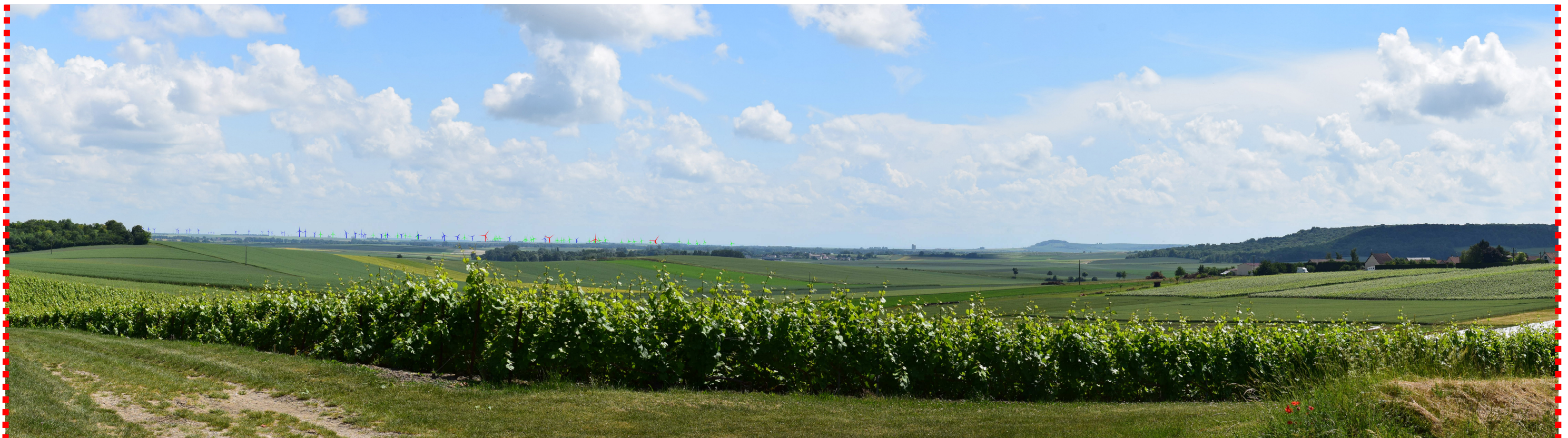
Photomontage d'interprétation recadré à 60°